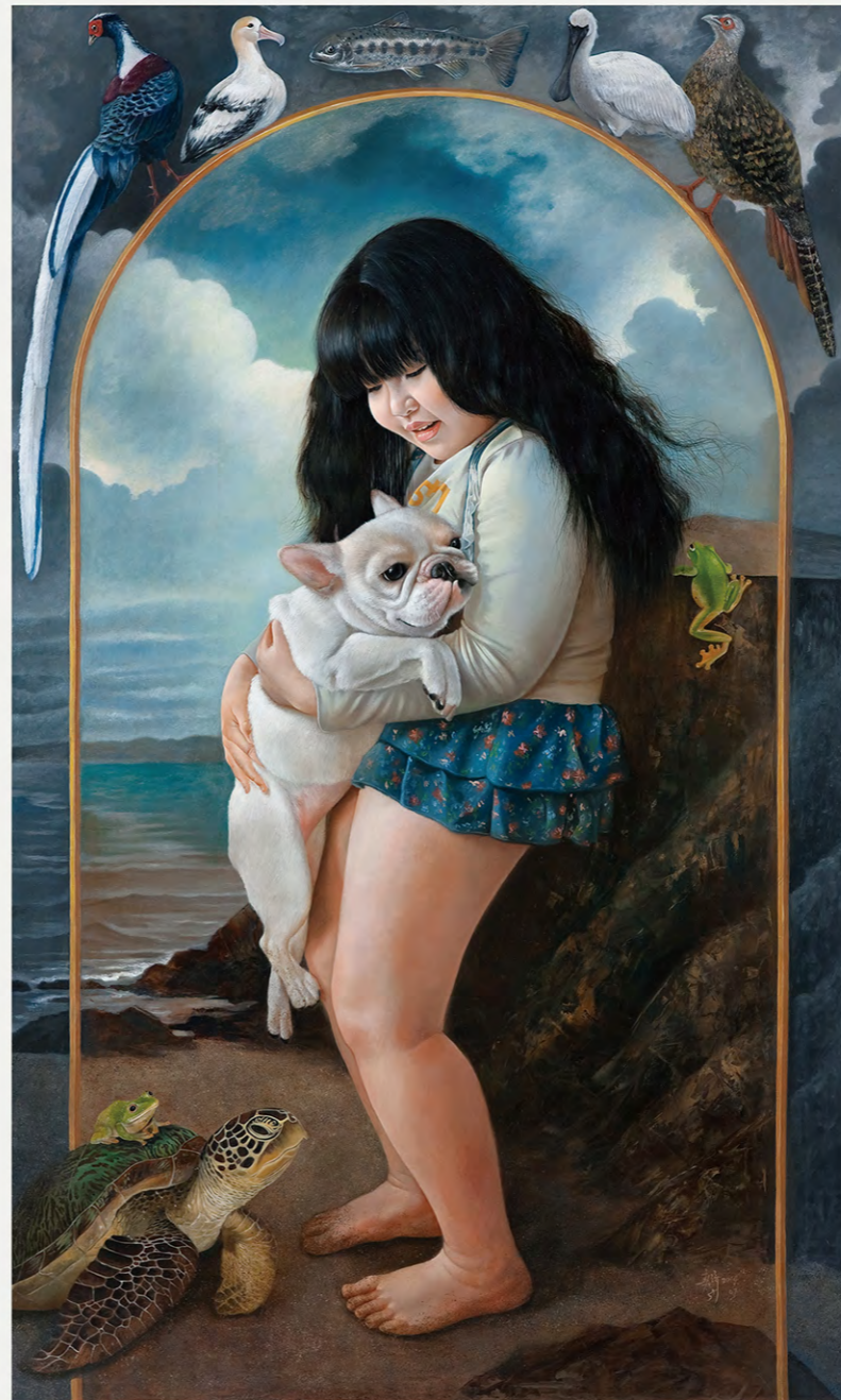
題目 愛•純粹 媒材 油彩、畫布 尺寸 162.0×97.0cm