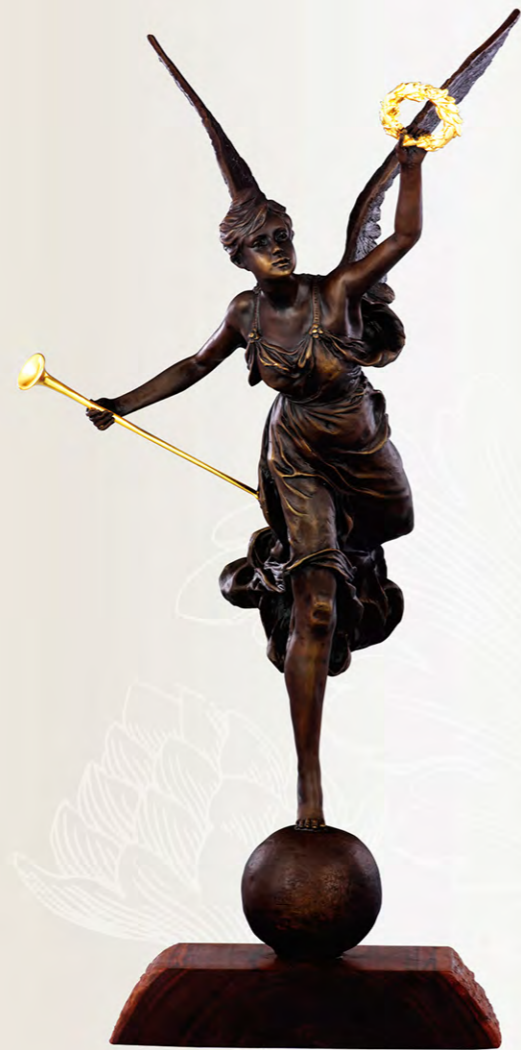
獎座製作者 - 創辦人 許文龍