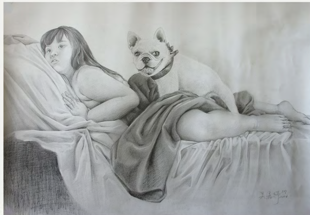
題目 女孩與狗 媒材 鉛筆素描 尺寸 55.0×79.0cm