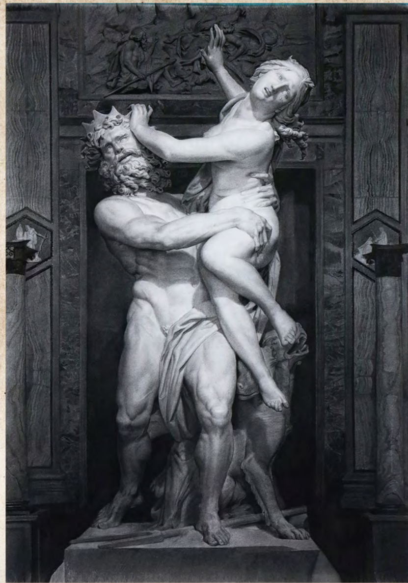
題目 冥王劫奪珀耳塞福涅 媒材 炭筆 尺寸 78.8×109.2cm 創作年代 2019