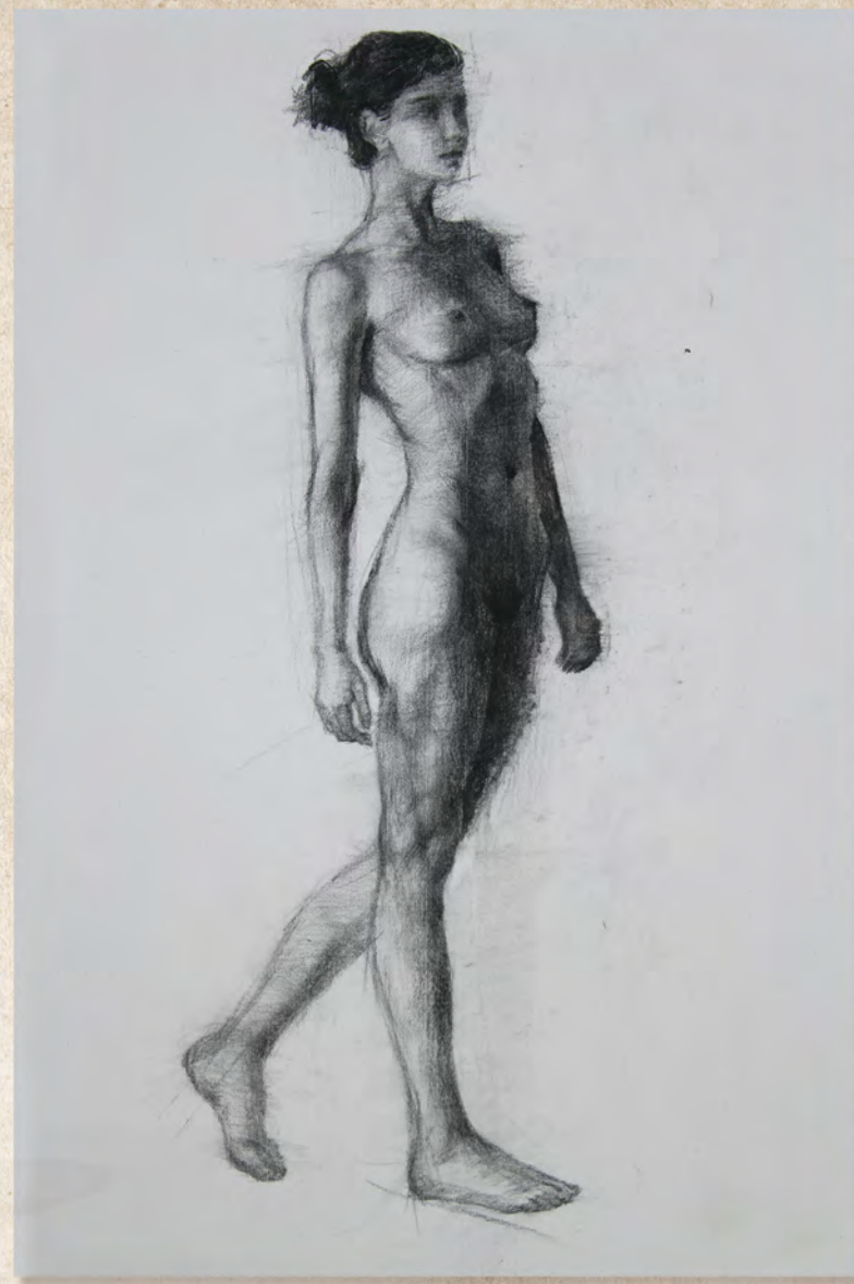
題目 無題 媒材 素描 尺寸 76×104cm 創作年代 2018