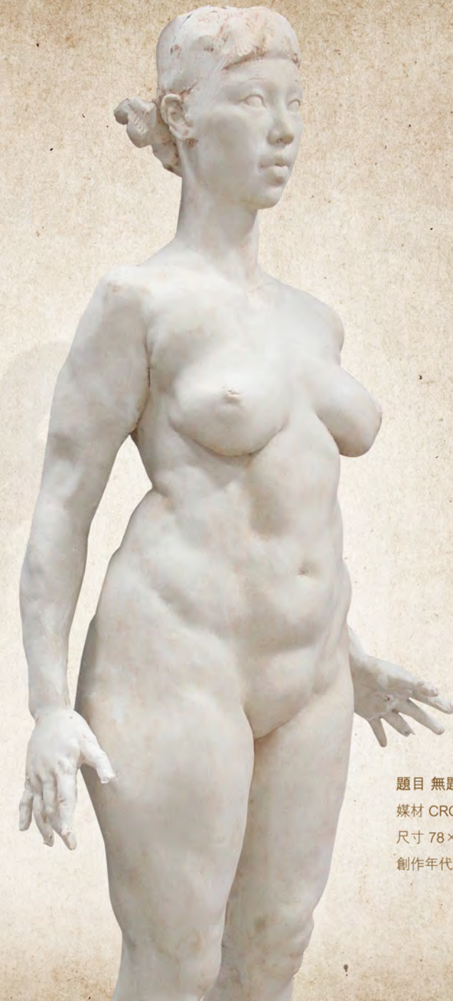
題目 無題 媒材 CRG 尺寸 78×21×15cm 創作年代 2018