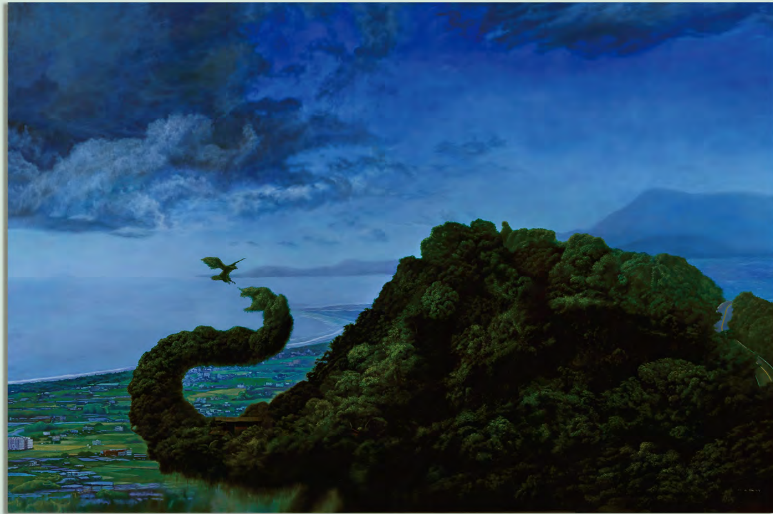
1 題目 二零一之夜2016 媒材 素描 尺寸 79×109 cm