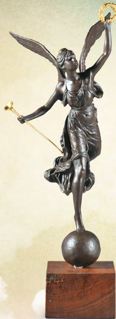
獎座製作者 - 創辦人 許文龍