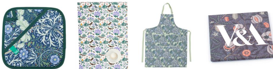
圖 V&A 博物館官方系列生活用品