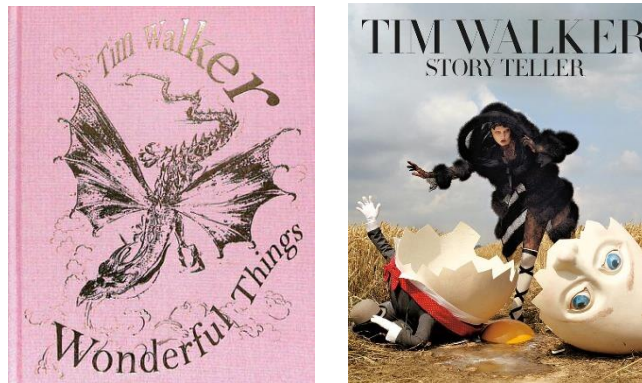
圖 蒂姆沃克展覽圖錄及藝術家作品集