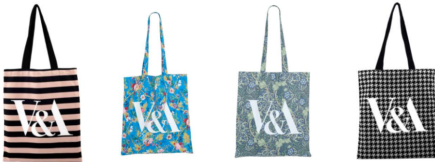
圖 V&A 博物館官方系列托特包

V&A 的禮品是全球博物館界中最具代表性之一，此次透過特展的合作爭取獨家引進 V&A 官方商品進駐奇美博物館。