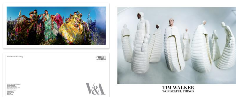
圖 V&A 博物館獨家授權台灣印製明信片及英國原裝進口珍藏海報