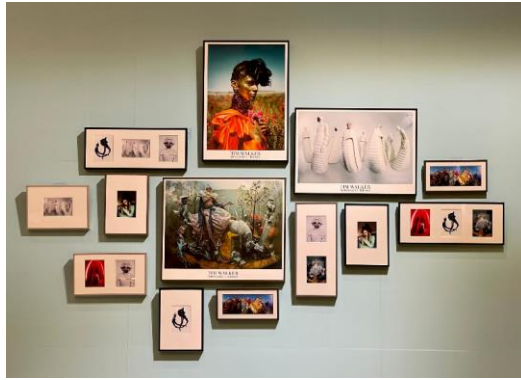
圖 明信片及珍藏海報禮品店展示